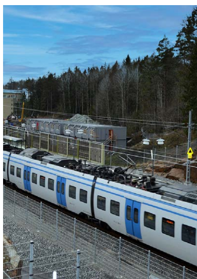
Vega pendeltågstation och Vega bostadsområde Haninge har markstabiliserats med en total längd på 700 000 meter pelare.

I grafen visas hållfastheten hos stabiliserade markprover från fält- och laboratorieförsök. De utförda provningarna visar att Multicem har en högre och jämnare hållfasthetstillväxt än KC 50/50. Det gäller både fältprovningarna och provningarna i laboratorium.