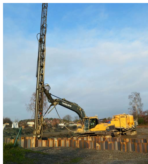
Bromstensstaden är ovanligt stort volymmässigt och omfattar närmare en miljon meter pelare.